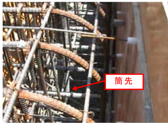
良い例（落下高さが低い）