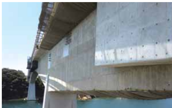
●主要県道光上関線(上関大橋)橋梁補修工事

この情報誌は土木技術に関する様々な情報を、山口県及び市町の土木技術職員の皆様方に提供するものです。