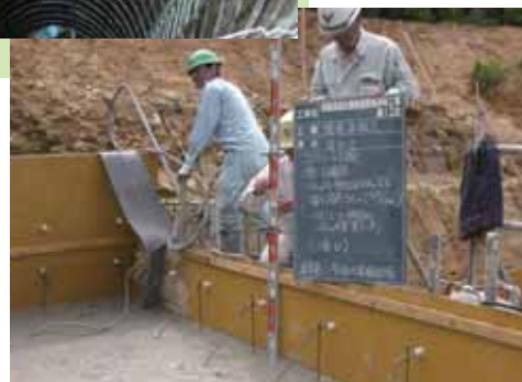
砂防堰堤コンクリート打設立会（早朝より対応）